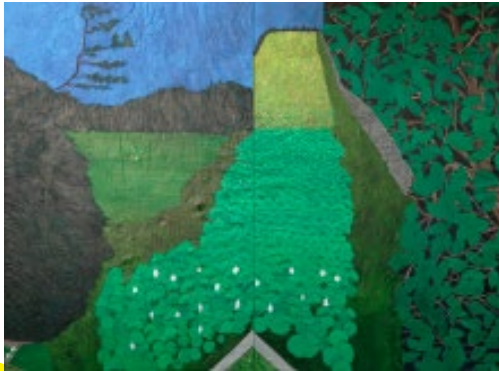
「絵は私の身体を通して世界を見る19_13」2019 鈴木星亜 (2012 VOCA賞)