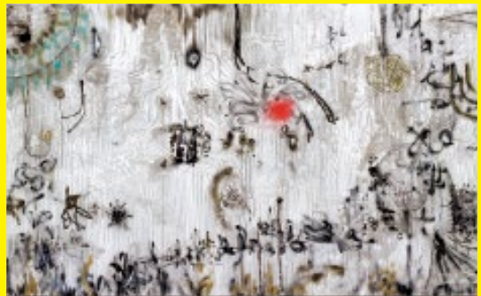
2019 VOCA 賞作品 「アテネ・長野・東京ノ壁ニアルデアロウ模写」東城信之介